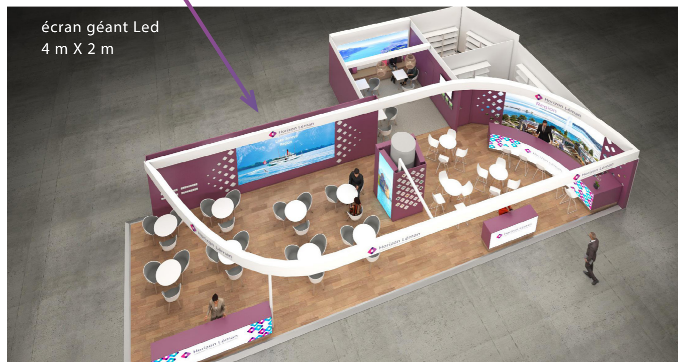
écran géant Led 4 m X 2 m